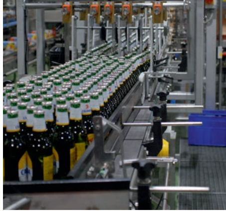
Beim Einlauf werden die Flaschen in Linien unterteilt ...

Eine zweite Besonderheit ist die Platzierung der Schaltschränke. Diese sind platzsparend und vor Feuchtigkeit geschützt oberhalb der beiden Wrap-Around-Maschinen montiert. Simon Dinkel, Teamleiter