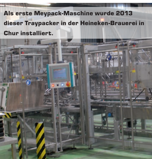
Als erste Meypack-Maschine wurde 2013 dieser Traypacker in der Heineken-Brauerei in Chur installiert.

Die beiden Wrap-Around-Maschinen sind baugleich, aber spiegelbildlich angelegt.