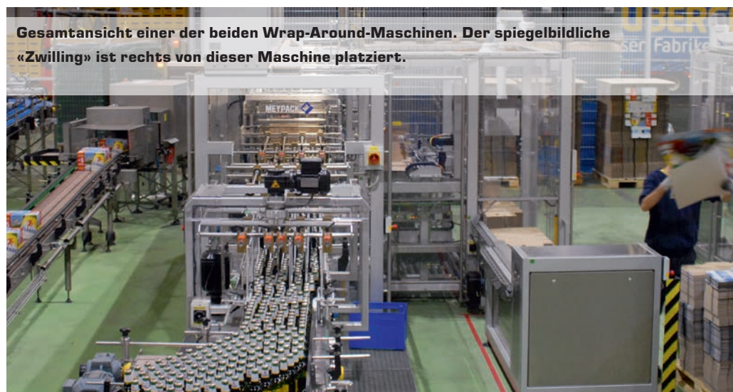
Gesamtansicht einer der beiden Wrap-Around-Maschinen. Der spiegelbildliche «Zwilling» ist rechts von dieser Maschine platziert.