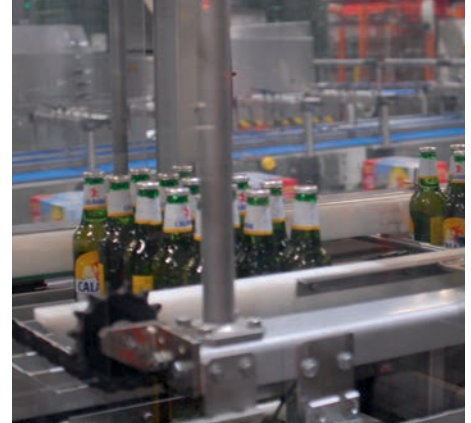
... und dann zum Lagenbild gruppiert.

Technisch sind die beiden Wrap-Around-Maschinen durch ihre modulare Bauweise und die kontinuierliche Arbeitsweise auf einer Ebene geprägt. Zur Bildung der Multipacks werden die Flaschen, die von der Abfüllmaschine kommen, den beiden Maschinen über eine Staustrecke zugeführt. Ein Servogruppierer am Eingang jeder Maschine vereinzelt zunächst die Flaschen und gruppiert diese dann zum gewünschten Lagenbild mit 6, 10, 12, 15 oder 24 Flaschen. Dann werden die gruppierten Flaschen auf den Wrap-Around-Zuschnitt geschoben, der Multipack geformt und verklebt. Nach dem