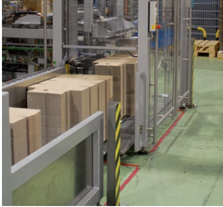
Zufuhr der Zuschnitte via Lift und Rollenbahn.

Ein Operateur kann so beide von der Mittelachse her bedienen. Eine weitere Besonderheit ist die teilautomatisierte Befüllung der Zuschnittmagazine. Jedes Magazin wird über einen Lift und eine Staustrecke mit den Zuschnitten versorgt. Der Operateur schiebt die Zuschnitte in bequemer Arbeitshöhe von einem Transportwagen auf den Lift. Dieser fährt mit dem Stapel nach unten und übergibt diesen auf die Staustrecke, die für drei Stapel ausgelegt ist. Von dort werden die Zuschnitte automatisch in das Zuschnittmagazin gehoben. Dank der hohen Speicherkapazität müssen selten Zuschnitte nachgelegt werden.